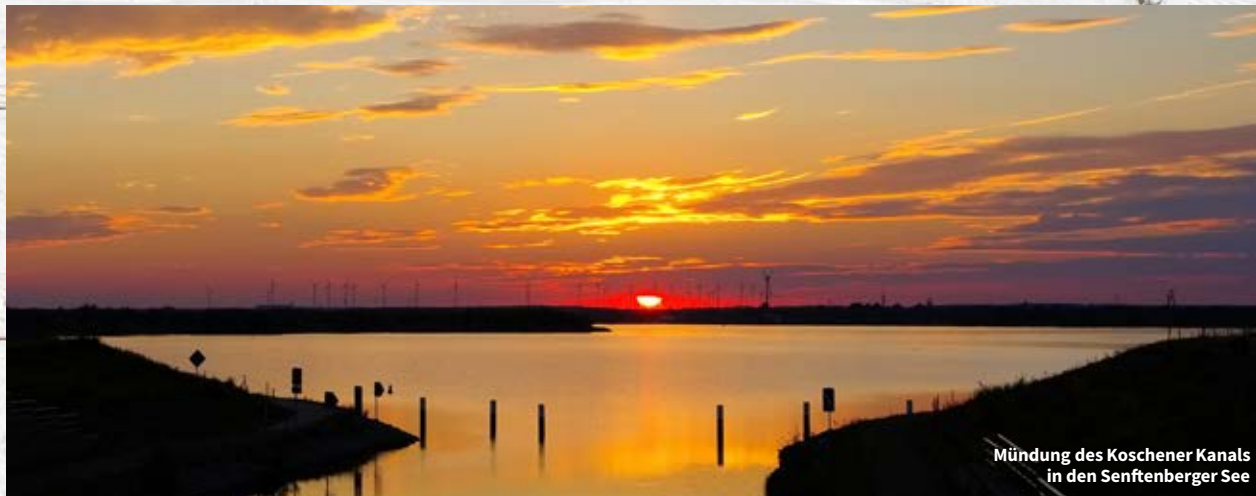
Mündung des Koschener Kanals in den Senftenberger See

Von den insgesamt 18 Kilometern Uferlänge sind mehr als 7 Kilometer als Badestrand ausgewiesen. Im April 2013 wurde in Senftenberg der Stadthafen eröffnet. Es entstand eine Marina mit über 100 Bootsliegeplätzen und einer 80 Meter langen schwimmenden Seebücke.