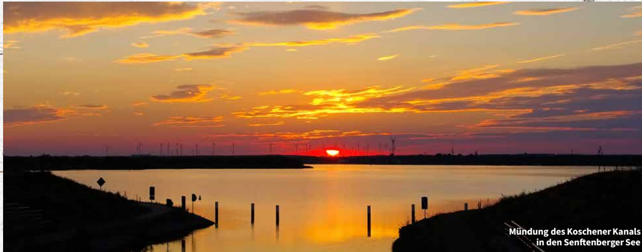
Mündung des Koschener Kanals in den Senftenberger See

Von den insgesamt 18 Kilometern Uferlänge sind mehr als 7 Kilometer als Badestrand ausgewiesen. Im April 2013 wurde in Senftenberg der Stadthafen eröffnet. Es entstand eine Marina mit über 100 Bootsliegeplätzen und einer 80 Meter langen schwimmenden Seebrücke.